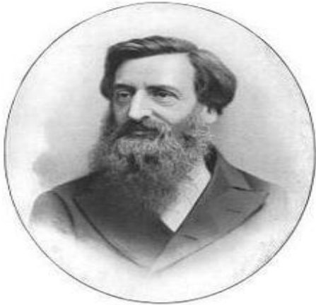
WILLIAM BOOTH 1879

Pelastusarmeijan perustaja ja liikkeen ensimmäinen kenraali William Booth