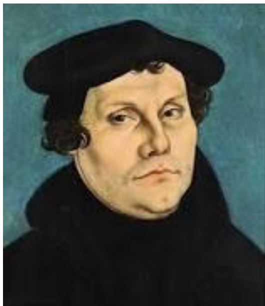
MARTTI LUTHER 10.11.1483 - 18.2.1546