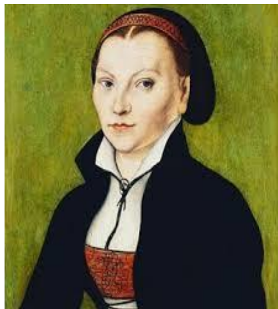
KATHARINA VON BORA 29.1.1499 – 20.12.1552