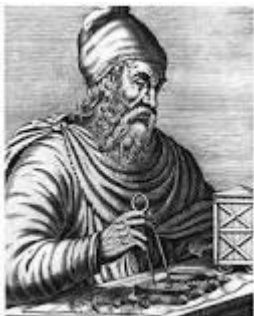
ARKHIMEDES 288 eKr. – 212 eKr.

”Kristuksen merkitys inhimilliseen ajatteluun Arkhimedeen pisteenä kiteytyy erityisesti Raamatun kuvauksessa Kristuksen ristinkuolemasta. Kristus tuomittiin syyttömänä kuolemaan, koska hänelle kateelliset ihmiset toteuttavat oikeusmurhan oman vihansa, kateutensa ja ennakkoluulojensa ohjaamina. Tämä prosessi tarjoaa näkökulman inhimillisen ajattelun ennakkoluuloisuuteen, rajoituksiin ja erehtyväisyyteen” (333).