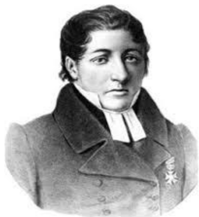
LARS LEVI LAESTADIUS 10.1.1800 – 21.2.1861