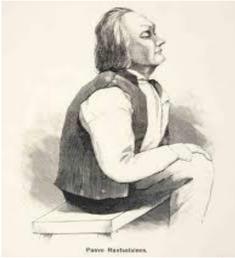
Paavo Ruotsalainen 9.7.1777 – 27.1.1852

”Sä suuriakin suruja Mun annat täällä maistaa, vaan sinun hetkes tultua Suot päivän uuden paistaa. Mun pelastat Ja uudistat Rauenneen toivon mulle, Siis sieluni Ja mieleni Tuo kiitoksensa sulle” (Vvk.337:7).