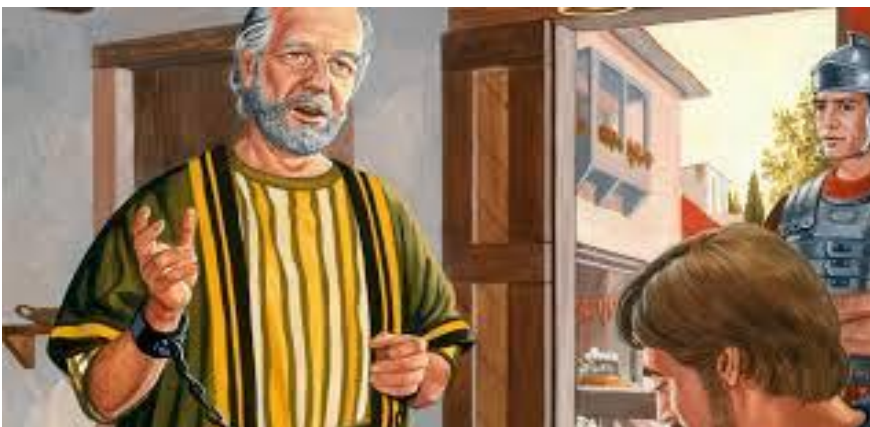
(nettikuva) (Paavali vankilassa)

"Emme tiedä Paavalin viimeisistä päivistä mitään. Kirje ilmaisee hänen eläneen jo rajan toisella puolella. " Tästedes on minulle talletettuna vanhurskauden seppele, jonka Herra, vanhurskas tuomari, on antava minulle sinä päivänä, eikä ainoastaan minulle, vaan myös kaikille, jotka hänen ilmestymistään rakastavat ", 2 Tim.4:8. Lähtijä pitää ovea auki jäljessä tuleville. Työntekijä hoitaa työtänsä vielä astuessaan rajan yli. Paavali ei voinut ajatella omaa autuuden osaansa muistamatta, että samasta autuudesta olivat osallisia toisetkin, jotka Kristuksen ilmestymistä rakastavat " (303).