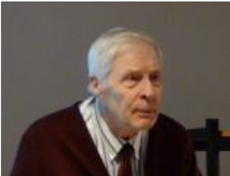
(nettikuva) VÄINÖ HOTTI