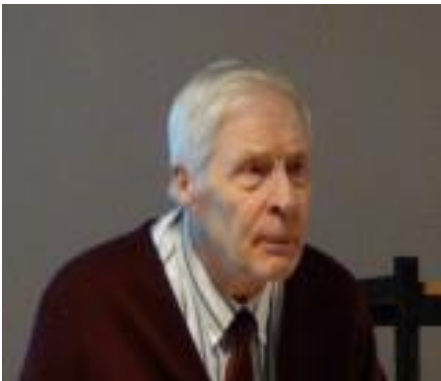
(nettikuva) VÄINÖ HOTTI