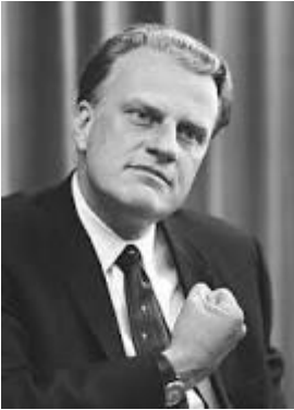
BILLY GRAHAM 7.11.1918 – 21.2.2018