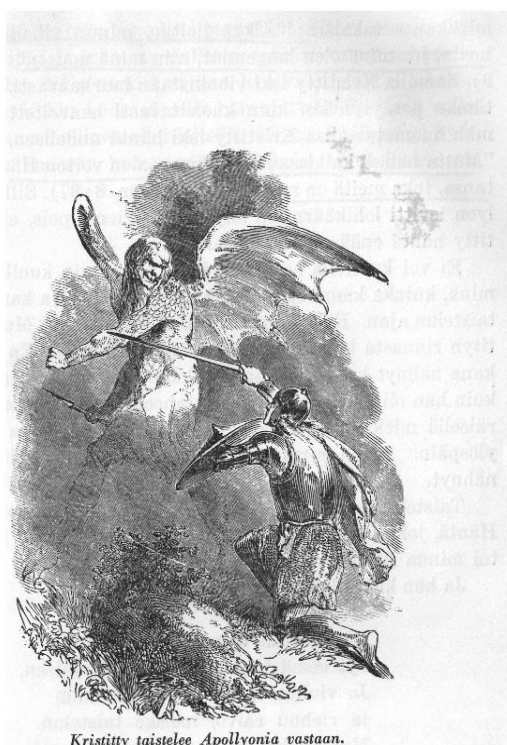
Kristitty taistelee Apollyonia vastaan.

Tässä Nöyryytyksen laaksossa Kristitty sai kokea kovaa, sillä hän ei ollut ehtinyt pitkälle, ennen kuin huomasi julman vihollisen tulevan kedon poikki vastaansa. Sen nimi oli Apollyon . Kristitty mietti, menisikö takaisin vai seisoisiko paikallaan. Hän muisti kuitenkin, ettei hänellä ollut selkäpuolellansa varustuksia, joten vihollisen olisi helpompi lävistää hänet nuolillaan, tjos hänelle kääntäisi selkensä. Sentähden hän päätti rohkaista mielensä ja taistella, sillä hän ajatteli: Vaikka kysymyksessä olisi pelkkä henkeni pelastaminen, niin sekin tapahtuu parhaiten taistelemalla.